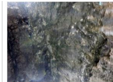
サツバ(舟から見た穴)連綿の天井